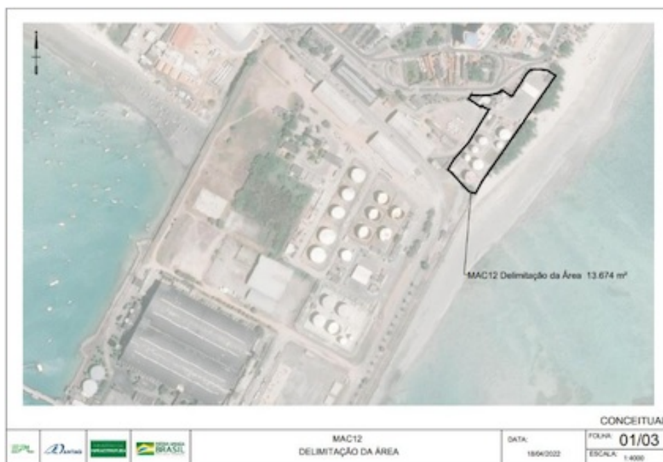
Figura 01 - Área de arrendamento MAC12 - Porto de Maceió/AL.

3.4. A área é caracterizada como brownfield , ou seja, já possui infraestrutura permanente dentro da área do futuro terminal MAC12, portanto, o empreendimento será executado sobre terreno operacionalmente em atividade.